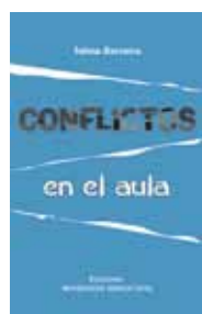
Conflictos en el aula Telma Barreiro